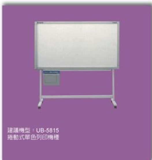
建議機型: UB-5815 捲動式單色列印機種