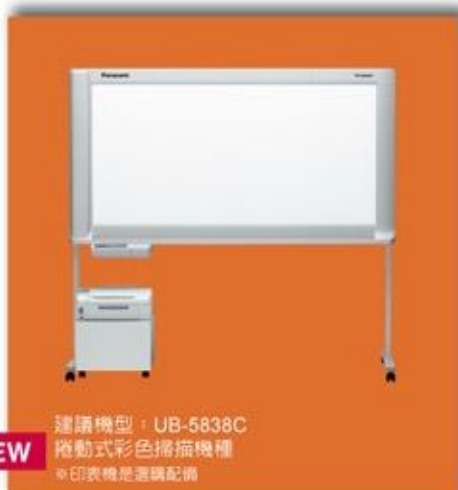
建議機型: UB-5838C 捲動式彩色掃描機種 ※印表機是選購配備