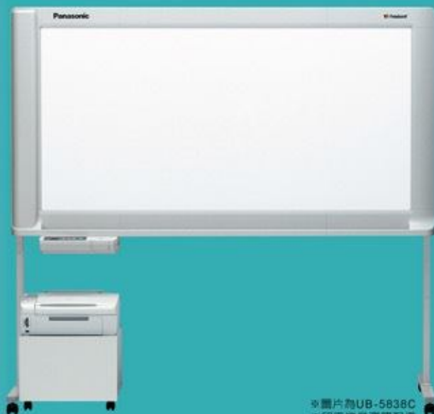
※圖片為UB-5838C ※印表機是選購配備